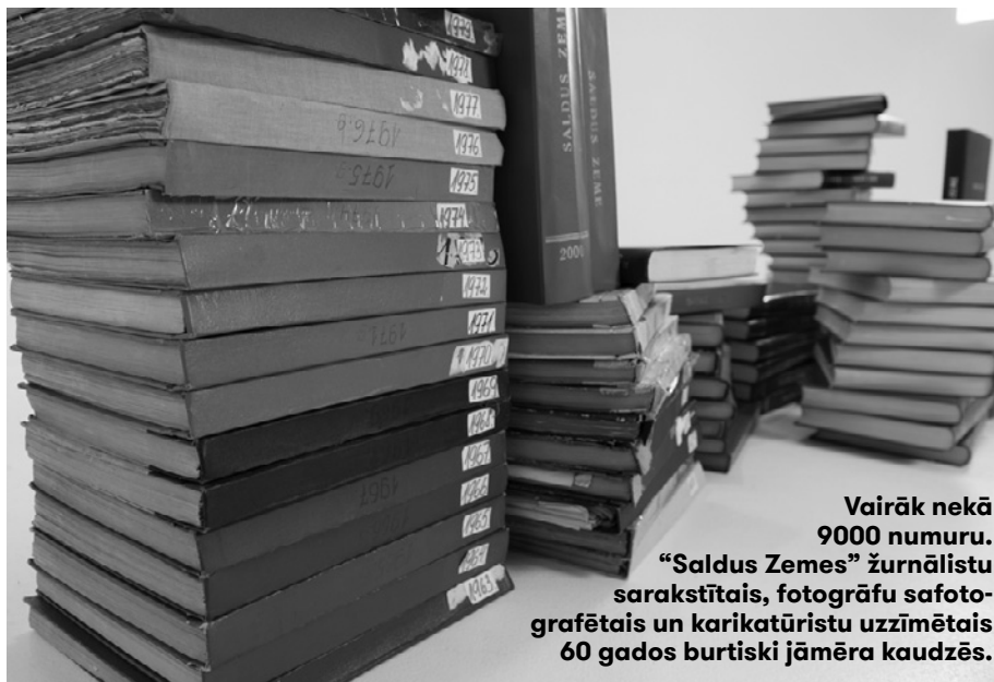
Vairāk nekā 9000 numuru. “Saldus Zemes” žurnālistu sarakstītais, fotogrāfu safotografētais un karikatūristu uzzīmētais 60 gadus burtiski jāmēra kaudzēs.

Vēsturisks notikums. 1989. gada 7. februārī Saldus avīze nomainīja savu nosaukumu no “Padomju Zemes” uz “Saldus Zemi”. Atmodas gados līdzīgi rīkojās daudzi laikraksti.