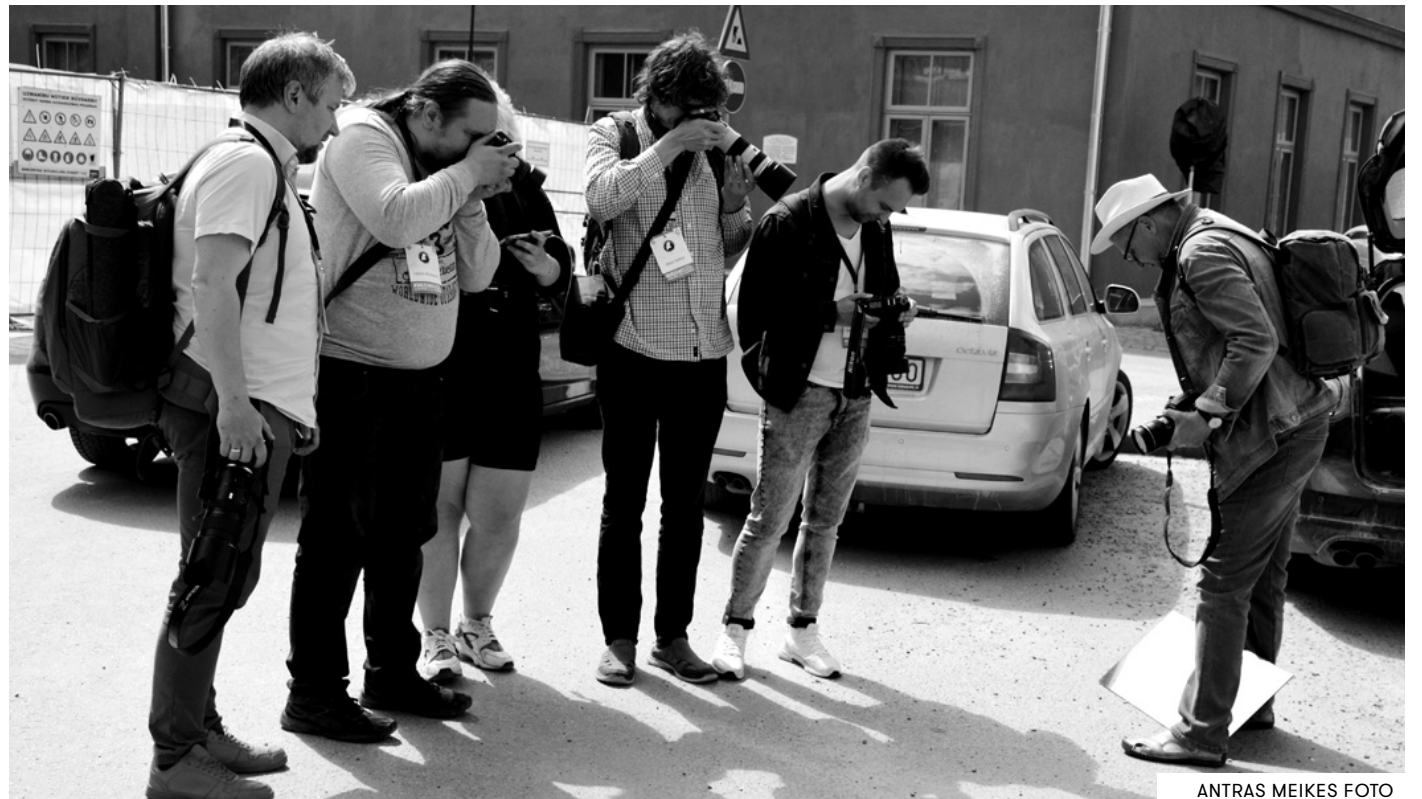
ANTRAS MEIKES FOTO

"Laikmeta liecību spektrs ir ļoti plašs," tā A. Gustovskis. "Šodien tā var būt vecmāmiņa ar mobilo telefonu vai planšeti, kovida laika parādības, kas nu jau aizmirstas, vai arī globālo klimata pārmaiņu sekas pie mums. Tāda noteikta rāmja pēc būtības nav. Galvenais – ieverot tehniskos