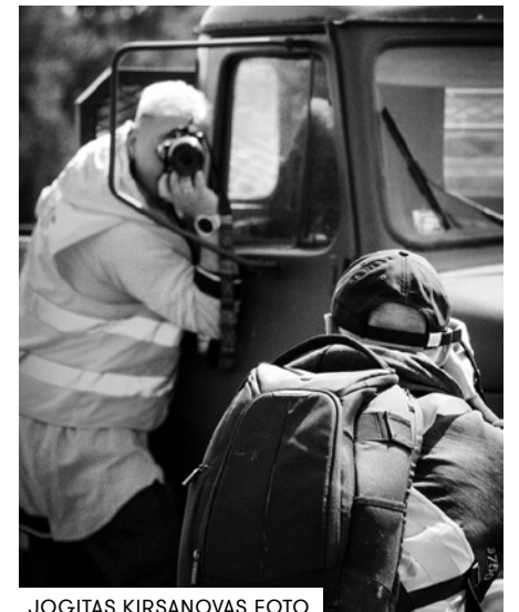
JOGITAS KIRSANOVAS FOTO

fotodienām gājušas plašumā. Interesi izrādījuši Rīgas un Vidzemes fotoklubi, kā arī draugi Lietuvā. Tā kopīgi ar lietuviešiem izveidots starptautisks konkurss projektā "Photography Kaleidoscope". Tajā iesaistās piecu valstu fotogrāfi, mākslinieku apvienības, nacionālie muzeji: no Latvijas, Lietuvas, Spānijas, Ungārijas un Slovēnijas. Šī konkursa tēma ir "Sign of the times" (Laika zīme) un sasaistās ar Kurzemes fotodienas radošajiem laikmeta liecību meklējumiem. Vienlaikus 30. septembrī būs arī šī fotokonkursa noslēgums. Starptautiskas žūrijas izvērtēto labāko darbu fotoizstādē būs Eirovīzijai līdzīgs šovs, ko translēs televīzijas tiešraidē. Pēc minētā dziesmu konkursa principiem izstādi vēros un par darbiem balsos fotogrāfi un skatītāji no piecām valstīm. ■