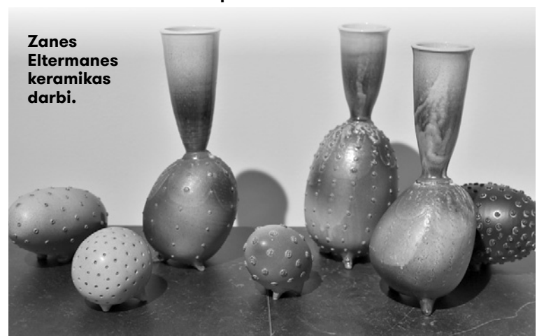
Zanes Eltermanes keramikas darbi.

Annas Eltermanes darbs, kas glabājas muzeja krājumā. Viņas radošais mūžs bijis ražīgs un vārds uz visiem laikiem ierindots labāko tekstilmākslinieku pulkā.