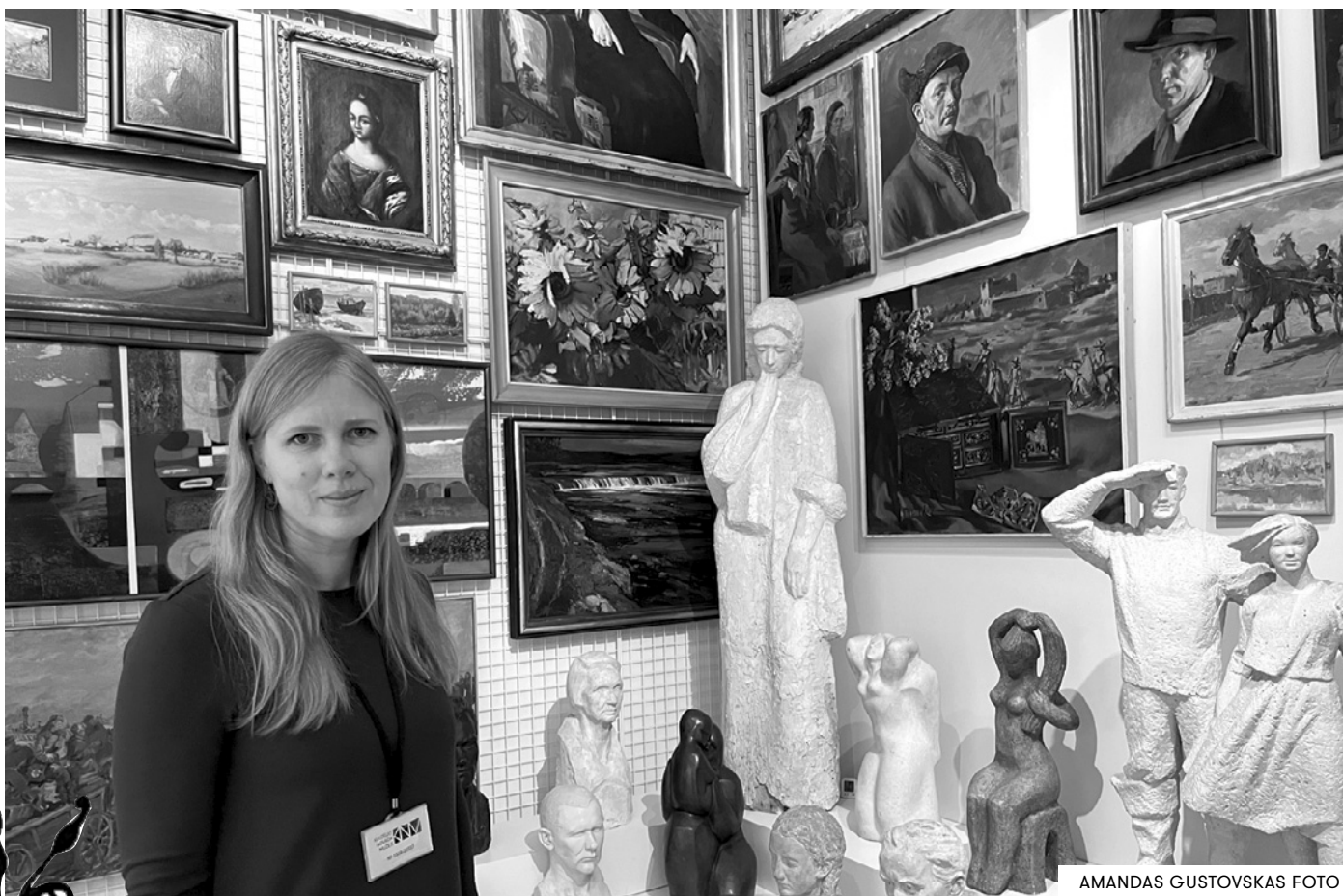
AMANDAS GUSTOVSKAS FOTO

Šī ekspozīcija ir vērtīga ar to, ka tajā ir ļoti daudz vēstures slāņu. Tas nozīmē, ka gidi katru ekskursiju var pielāgot un stāstīt nedaudz citādāk. Tāpat muzeja pedagogs