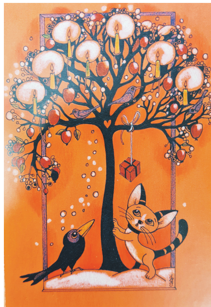
Ābele autorei ir mīļš Ziemassvētku tēls.

Tolaik saldeniece nenojauta, ka skaista rokraksta dēļ sastaps cilvēkus no viņai tālām jomām. Piemēram, bijis jābrauc dziļos mežos un tālās pļavās, lai sarakstītu diplomus mednieku un maksšķerņieku